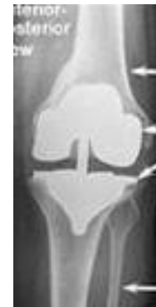
ลักษณะของข้อเข่า