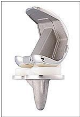
ลักษณะของข้อเข่าเทียม

การผ่าตัดเปลี่ยนข้อเข่า คือ การเปลี่ยนผิวกระดูกอ่อนของข้อ มาคลุมด้วยวัสดุเหล็กผสมไททานเนียม และโพลีเอทิลีนที่คงทนถาวร หลังผ่าตัดยังคงมีการเคลื่อนไหวได้เหมือนปกติ อาการปวดของเข่าจะหายไป เข่าที่เคยโก่ง เก จะตรงเหมือนข้อเข่าในคนปกติ จะมีการเคลื่อนไหวอย่างน้อยของถึง 90 องศา และเหยียดตรงได้ ข้อเข่าเทียมมีอายุการใช้งานได้นานถึง 20 ปี ถ้าดูแลตนเองได้ดี