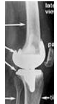
ลักษณะของข้อเข่า

ก่อนการเปลี่ยนข้อเข่าเทียม หลังการผ่าตัด เมื่อใส่ ในภาพถ่ายเอกซเรย์ ข้อเทียมเรียบร้อยแล้ว