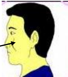
โหนกแก้ม