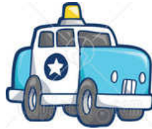
รถราชการ