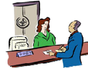
ห้องโถงโรงแรมที่ ติดเครื่องปรับอากาศ