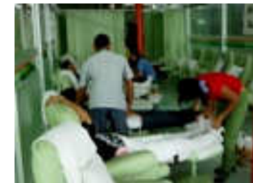
ร้านนวดแผนไทย และ ร้านนวดแผนโบราณ