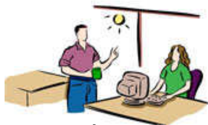
ในที่ทำงาน