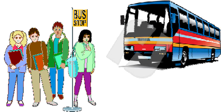
ป้ายรถเมล์/ท่ารถ และบนรถประจำทาง