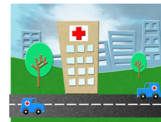
โรงพยาบาล