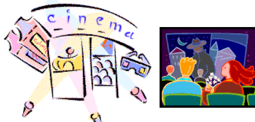
อิมจันทร์ดูกีฬาหรือการแสดง