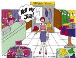
ห้าง สรรพสินค้า