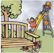
สวนสาธารณะ