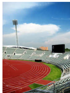
สนามกีฬา หรือ สถานที่ออกกำลังกาย กลางแจ้ง