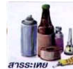
สารระเหย

สารระเหย เป็นสารเคมีที่นำมาสูดดมกัน จะมีลักษณะเป็นของเหลว มีกลิ่นหอมและระเหยได้ง่าย ได้แก่ สารระเหยพวกทินเนอร์ แล็กเกอร์ กาว ออกฤทธิ์กระตุ้นและกดประสาทส่วนกลาง ทำให้มีอาการเคลิ้มฝัน มึนงง เวียนศีรษะ คลื่นไส้ อาเจียน เสรไปนานๆ ทำให้เกิดโรคแทรกซ้อน เช่น มะเร็งในเม็ดเลือด สมอพิการ ตับพิการ