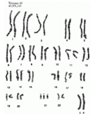
รูปแสดงโครโมโซมคู่ที่ 21 มี 3 แท่ง

สาเหตุของลงมาเรียกว่า Translocation คือมีโครโมโซมย้ายที่ เช่น โครโมโซมคู่ที่ 14 มายึดติดกับคู่ที่ 21 เป็นต้น พบได้ร้อยละ 4 ส่วนสาเหตุที่พบน้อยที่สุดคือ มีโครโมโซมทั้ง 46 และ 47 แท่งในคน ๆ เดียวกัน พบได้เพียงร้อยละ 1 เท่านั้น เรียกว่า MOSAIC