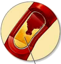
ไขมันลิ่มเลือด ไปอุดตันที่หลอดเลือดแดงโคโรนารี ทำให้เลือดไม่สามารถไหลเวียนไปเลี้ยงหัวใจได้

มีการตีบตันของหลอดเลือดแดงที่ไปเลี้ยงกล้ามเนื้อหัวใจ เนื่องจากมีการเปลี่ยนแปลงของเส้นเลือดที่เลี้ยงหัวใจและมีเกล็ดเลือดเกาะตัวกันเป็นลิ่มเลือดอุดตันเส้นเลือด เนื้อเยื่อของกล้ามเนื้อหัวใจไม่ได้รับเลือดไปเลี้ยง